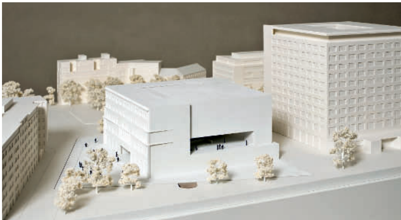
1. Preis: Marte.Marte Architekten