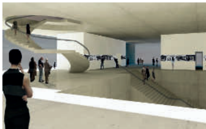
Abbildungen: Marte.Marte Architekten

wichtig. Die skulpturale Durchbildung des monolithischen Baukörpers macht es zu einem Markstein im Stadtbild von Berlin. Durch die gute funktionale und zugleich spannungsreiche innenräumliche Organisation wird es zu einem selbstbewussten Bestandteil der Museumslandschaft in der Hauptstadt. Die Öffnung des Gebäudes zum Gelände der Topographie des Terrors hebt geschichtliche Bezüge zwischen Vertreibung und Deportation ins Bewusstsein. Nicht nur Baukulturinteressierte werden sich an die bewegte Entstehungsgeschichte des Dokumentationszentrums erinnern, die nach Wettbewerben über das gescheiterte Projekt von Peter Zumthor zu der Verwirklichung des Konzeptes von Ursula Wilms führte. Bernhard und Stefan Marte sind Vertreter der nach der österreichischen Region benannten Voralberger Architektur, die seit langem mit ihrem eigenwilligen Umgang mit Volumen und Struktur zu einem baukulturellen Markenartikel geworden ist. Die beiden Brüder Marte errichteten ihr Architekturbüro in jenem Haus in der kleinen Ortschaft Weiler, in dem sie ihre Kindheit verbrachten. Der biographische Bezug zu Ort und Zeit, dessen Verlust die Stiftungsarbeit thematisiert, kann ein Ansatz zum Verständnis des Werkes sein.